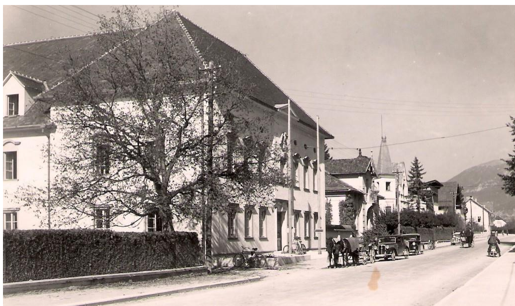
Cesta proti Lescam (mimo občine), ok. 1943