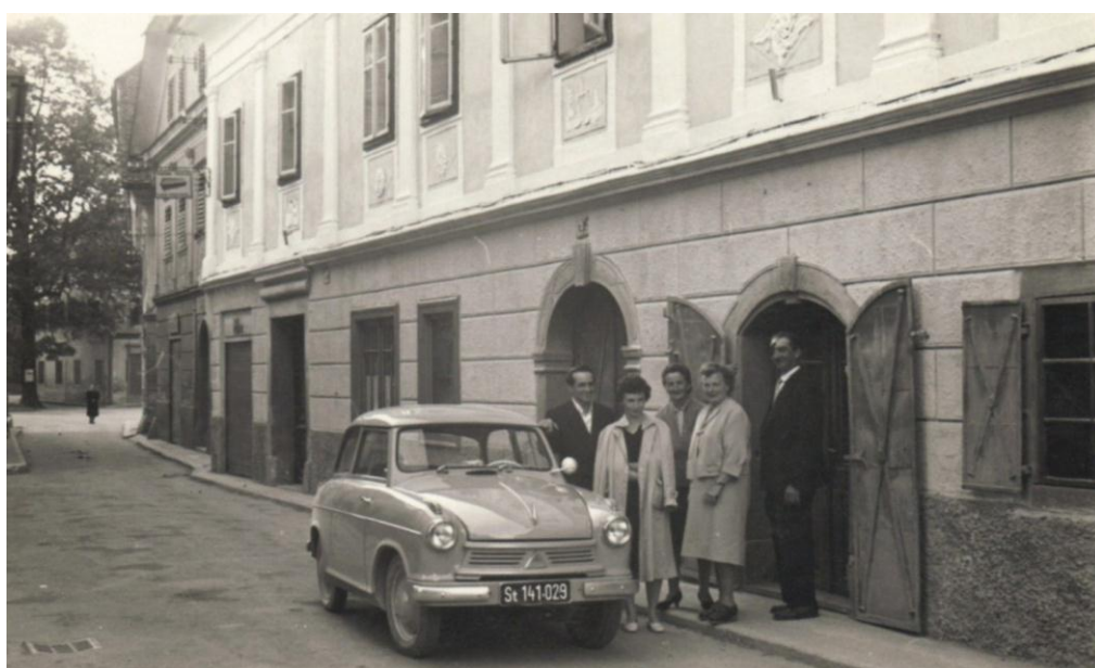
Cesta mimo Mencingerja, ok. 1950