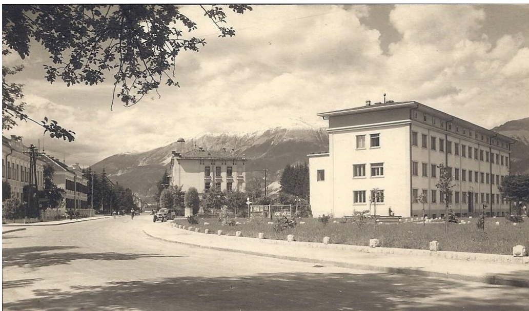
Križišče med hotelom Grajski dvor in hranilnico Lesce/Kropa, ok. 1935