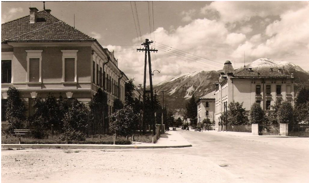
Cesta proti Lescam, ok. 1940