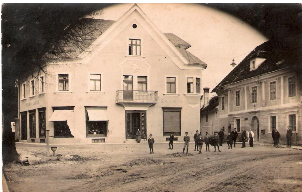
Cesta mimo Savnika, ok. 1935