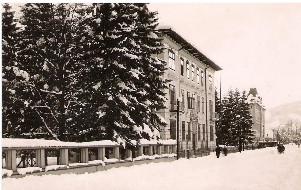
Cesta proti Lescam (mimo Posojilnice), ok. 1940