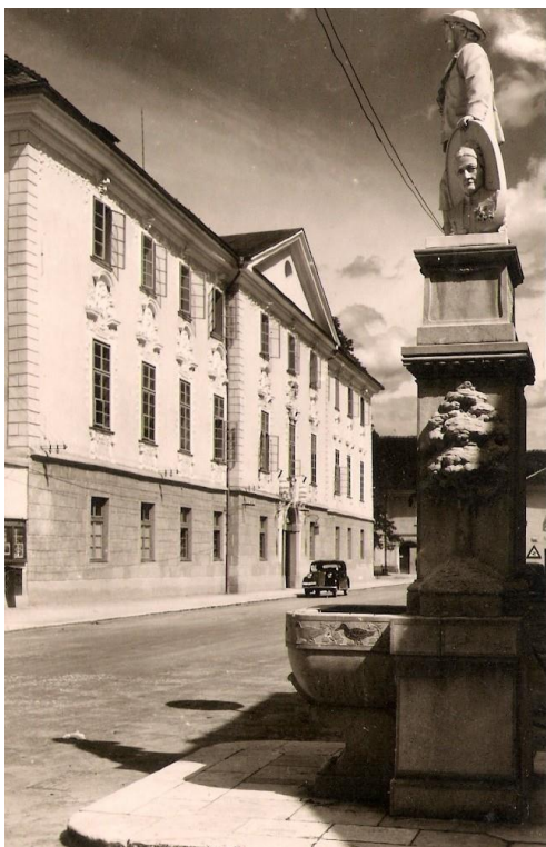
Cesta mimo Graščine, 1943