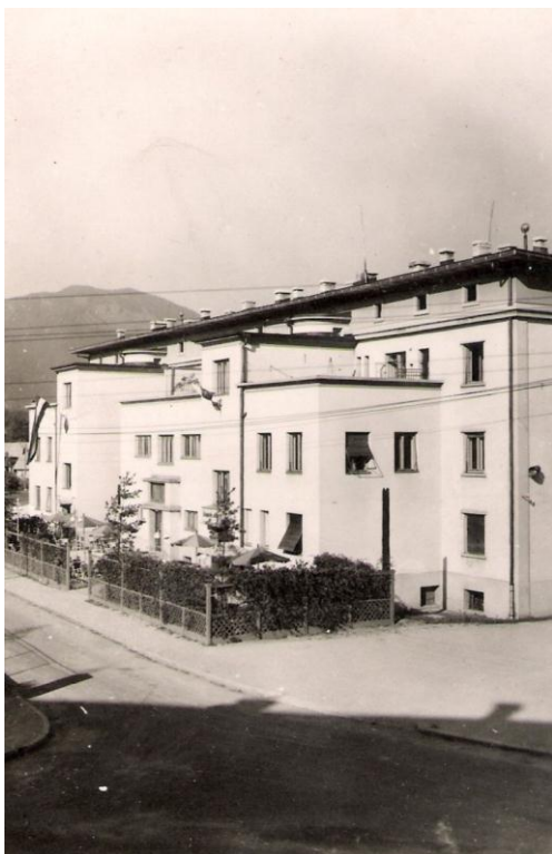
Cesta ob hotelu Grajski dvor, ok. 1940