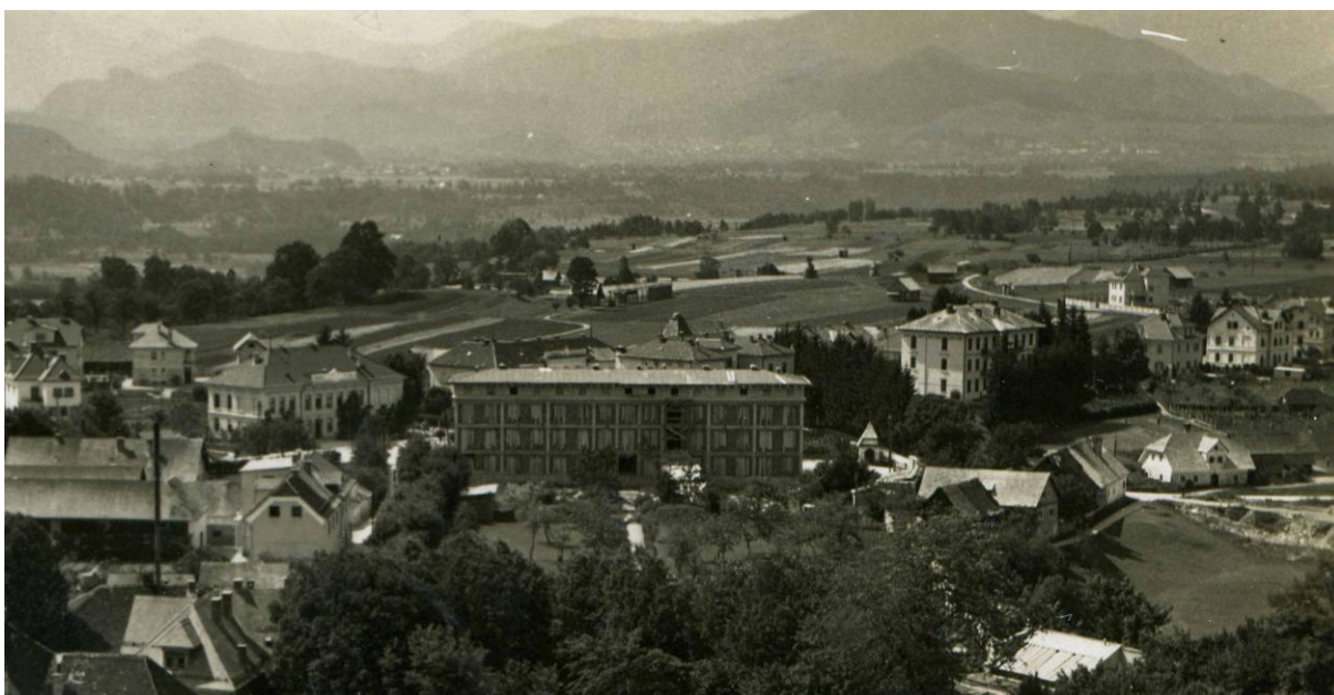
Cesta za hotelom Grajski dvor (od Makaca do Narodne šole), 1932 Vir: Digitalni arhiv Radovljica (detajl)