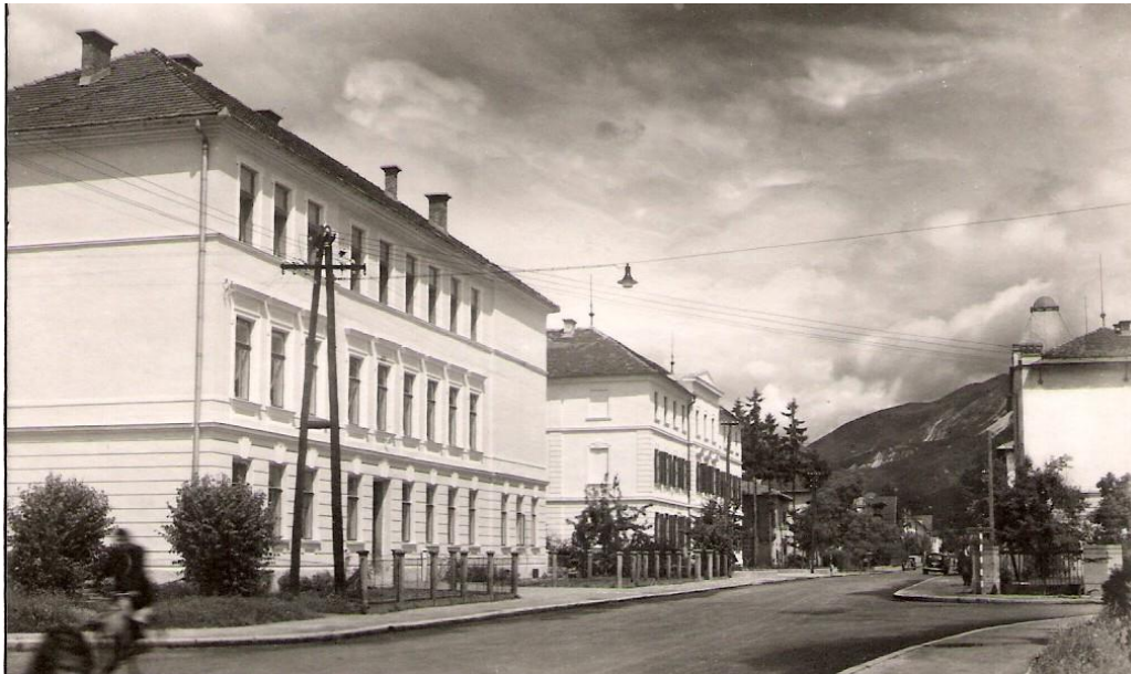
Priključek za Kropo pri hotelu Grajski dvor, ok. 1950