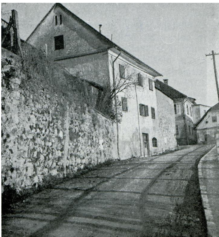
Cesta mimo Burcelja in Bezulneka, ok. 1950