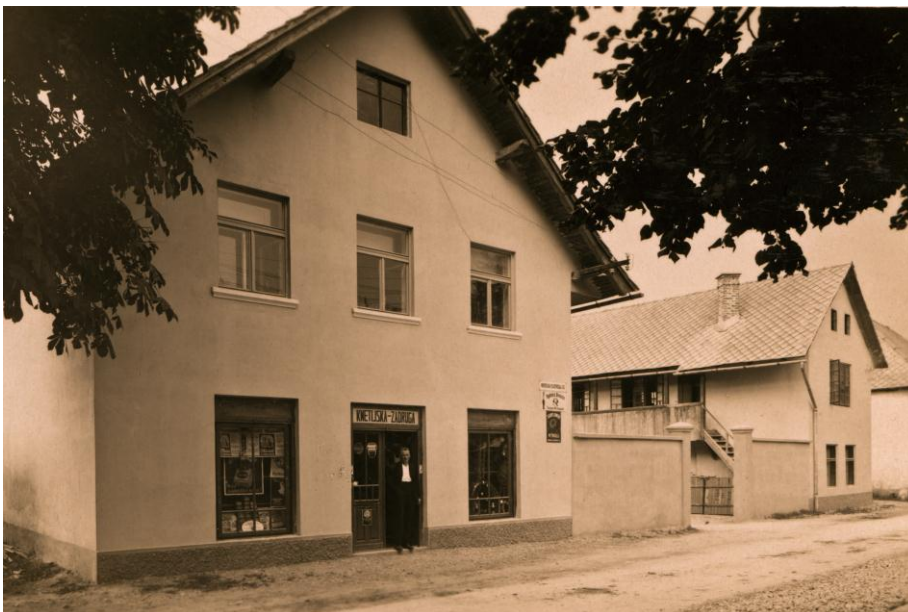
Cesta mimo Zadruge, ok. 1940