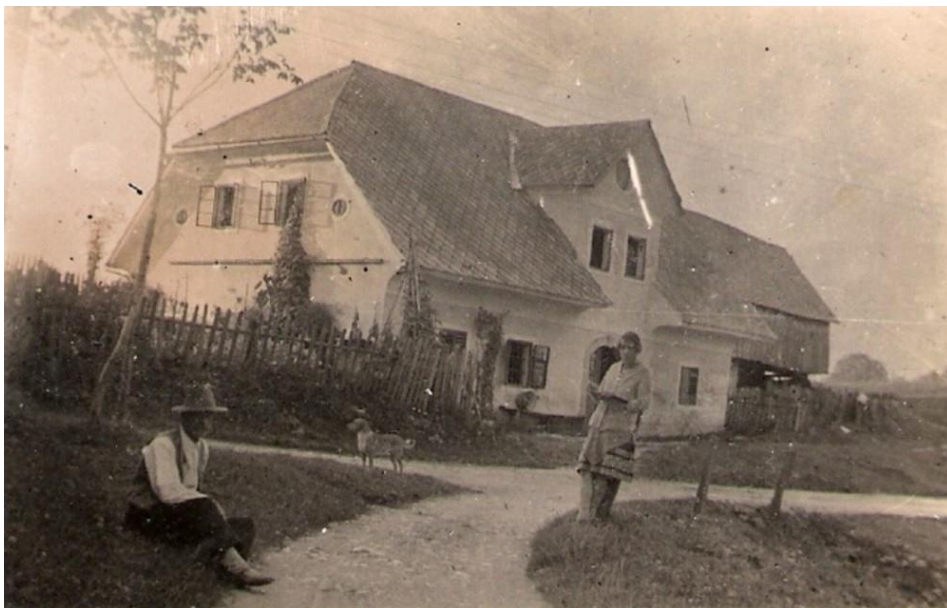
Cesta mimo Makaca, ok. 1935